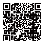
高鐵接駁車時刻表